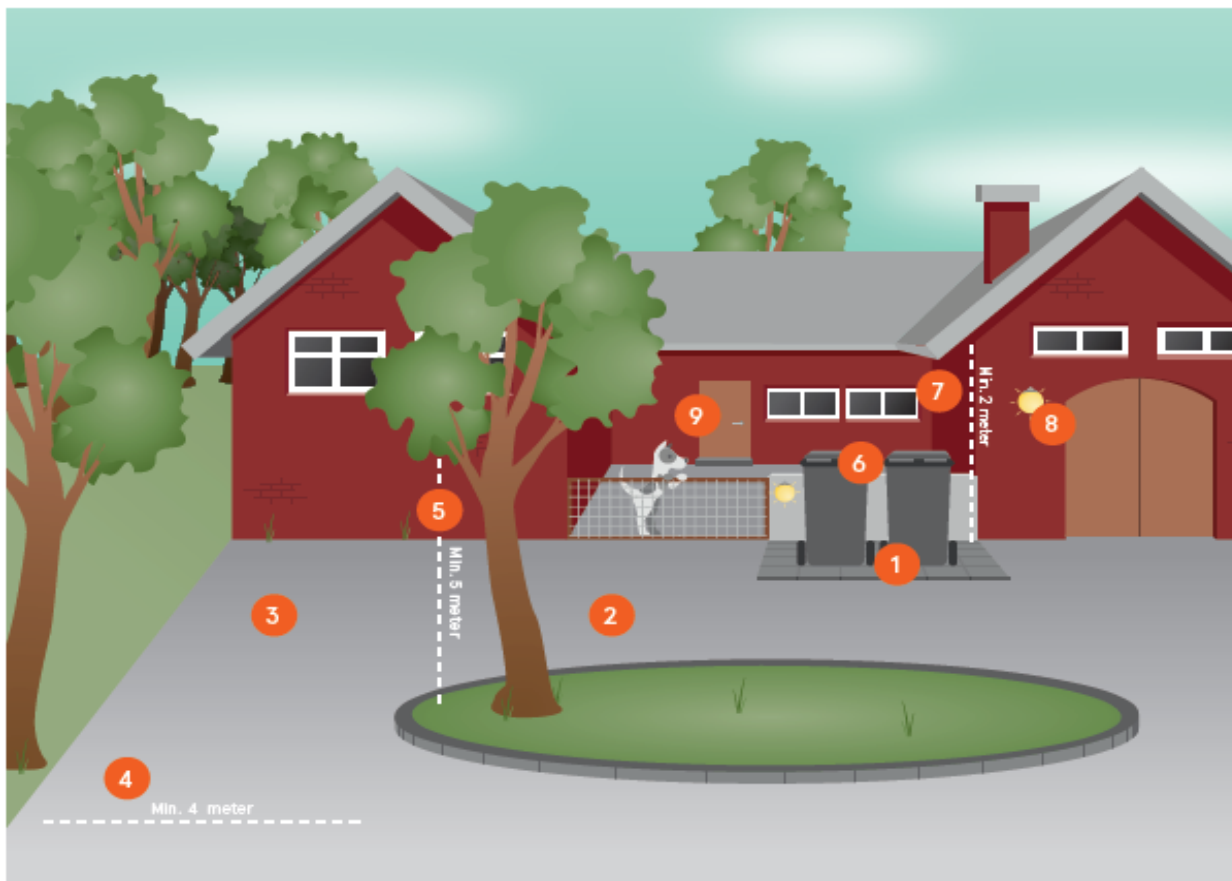
Figur 3: Placering af affaldsbeholdere på landejendomme