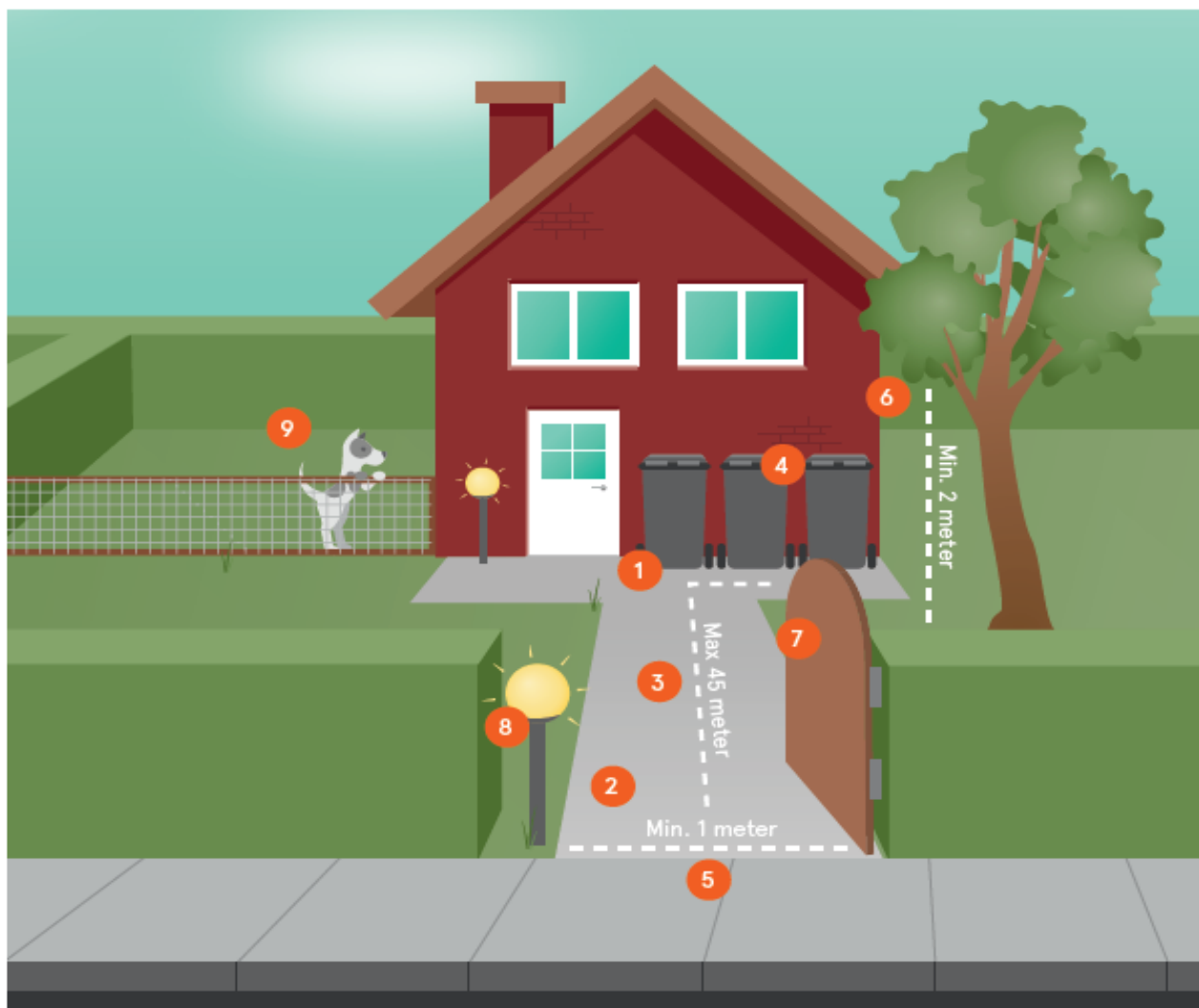
Figur 2: Placering af affaldsbeholdere på tømmedagen – afhentning på standplads