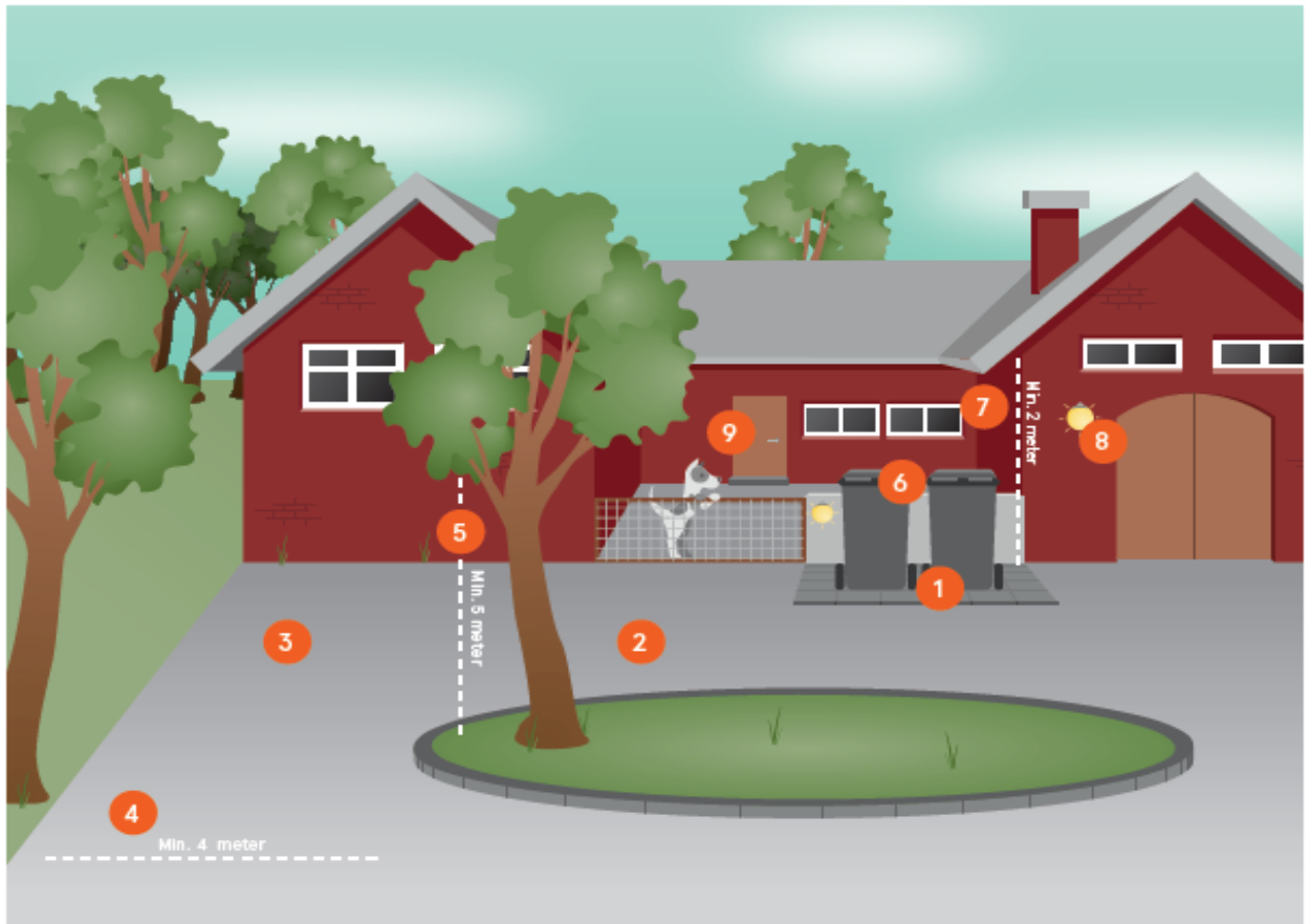
Figur 3: Placering af affaldsbeholdere på landejendomme